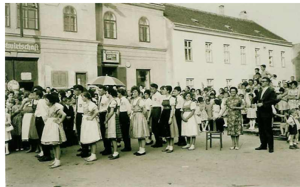
Die Jugend war eingebunden: beim Berufespiel und beim Volkstanzen