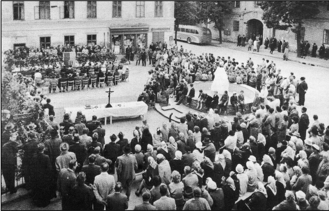
Die ganze Bevölkerung feierte mit.